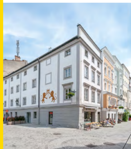
Bäckerhaus, © [tp3] architekten