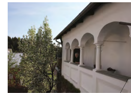
Arkadenhof, © Architekturbüro Arkade

20 Uhr, TUK – Alter Kinosaal Haslach, Marktplatz 11