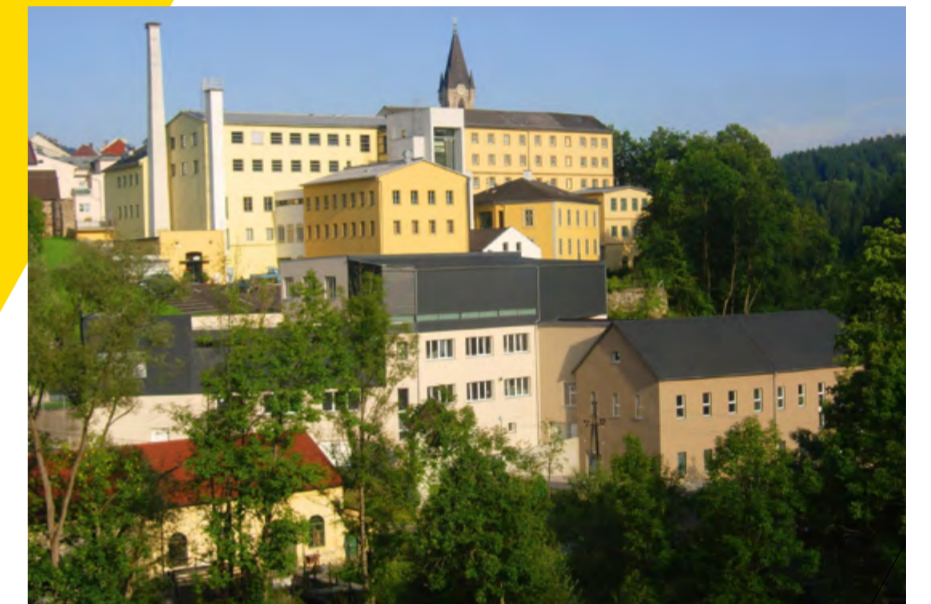
Haslach Vonwillerareal, © Architekturbüro Arkade

Shuttleservice: Anmeldung bis 25. Mai erforderlich, Anmeldung zum Vortrag, Werksführung, sowie zum Shuttle-Bus bitte an: architektur@inprogress.at