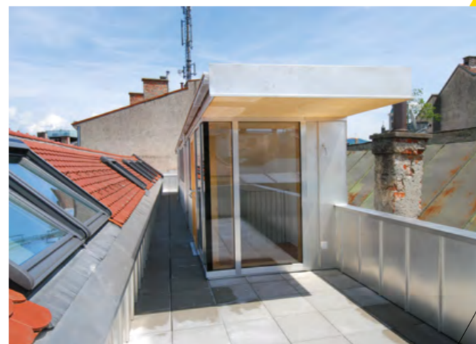
Bäckerhaus, © [tp3] architekten